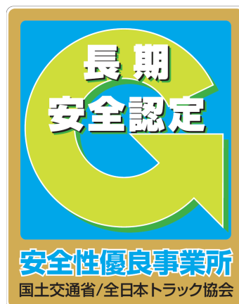
ゴールドステッカー デザイン