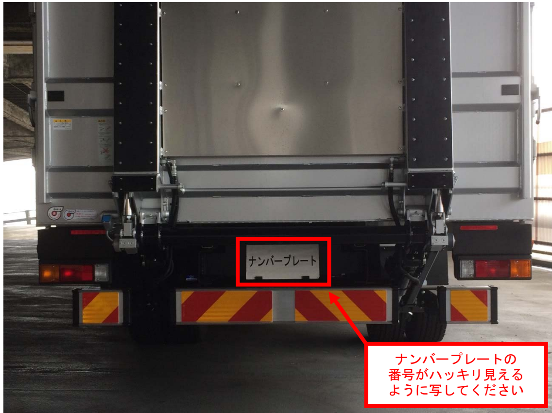
写真① 車両後方写真（事例）

装着車両の後方から、テールゲートリフターが車両に装着していることが確認できるように撮影してください。