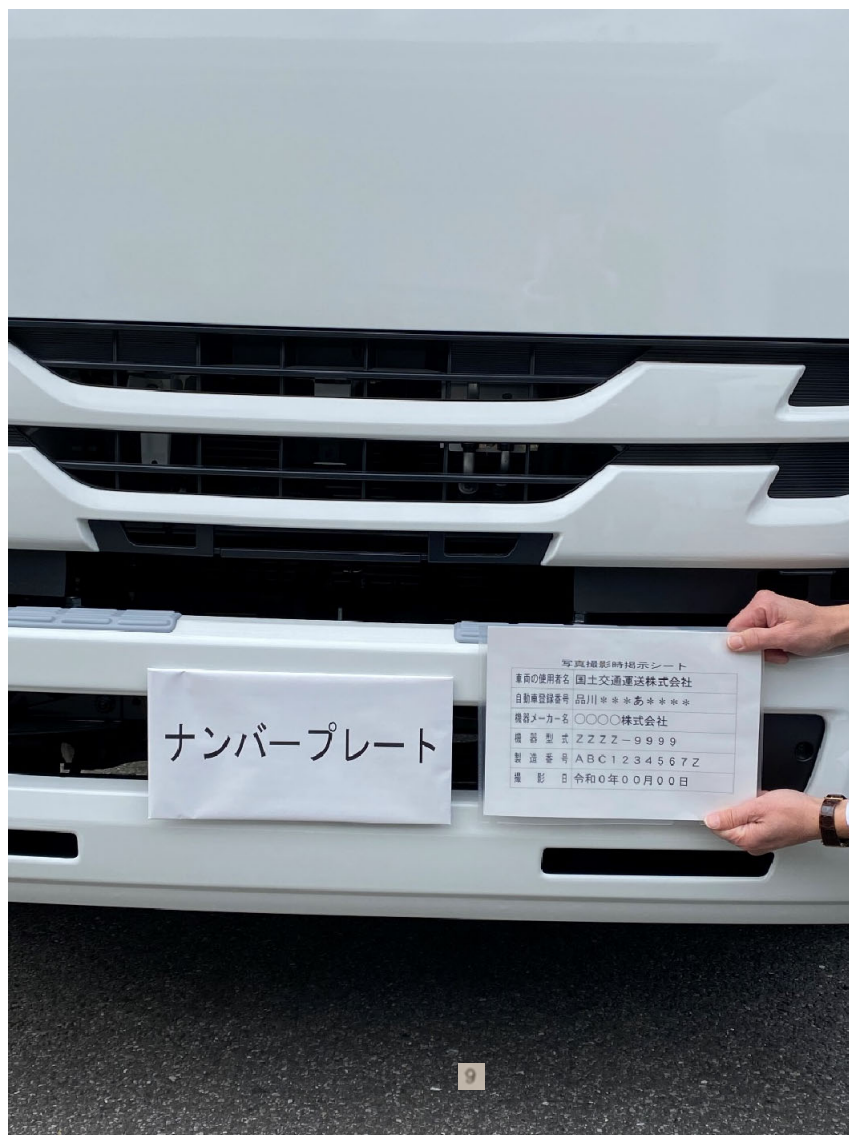
写真② 自動車登録番号（ナンバープレート）と写真撮影時掲示シート（事例）

●ナンバープレートと写真撮影時掲示シートの内容がハッキリ見えるように撮影してください。