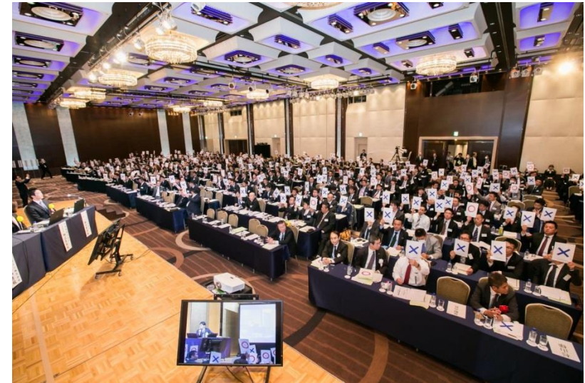
全国から730名の青年経営者が参加 (昨年の模様)