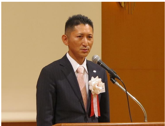
中部ブロック大会 (11月11日／約200名参加)