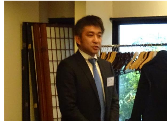
笠原青年部会長(当時)