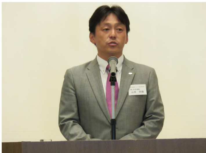
関東ブロック大会 (平成28年6月25日／約220名参加)