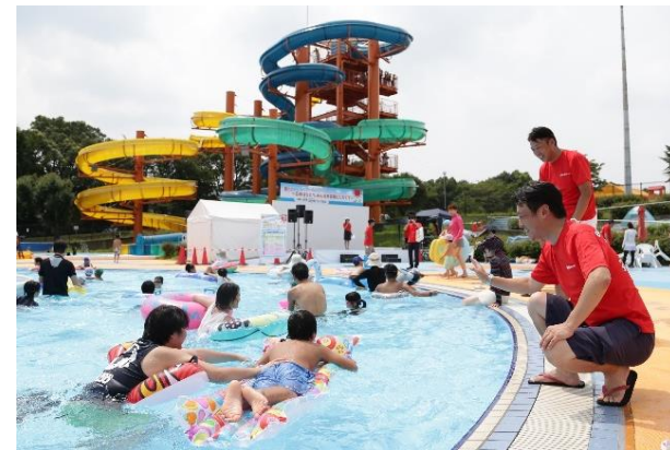
プールを楽しむ子供たち