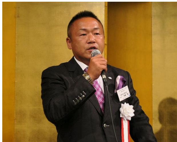
近畿ブロック大会 (8月20日／約480名参加)