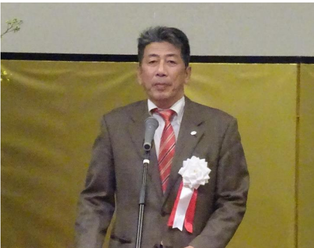
中国ブロック大会 (11月26日／約150名参加)