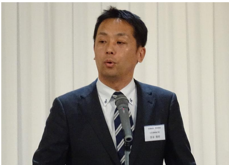
北海道ブロック大会 (平成28年7月8日／約140名参加)