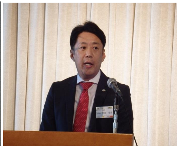
九州ブロック大会 (2月4日／約270名参加) 7