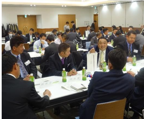
女性ドライバーの雇用促進をテーマに グループディスカッションを行う