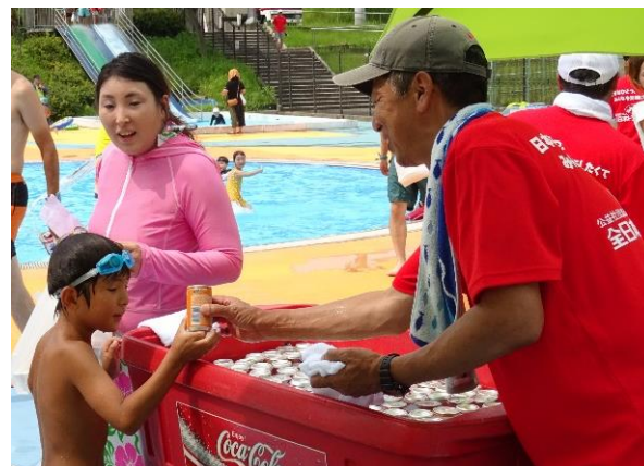
全国の青年部会員も応援