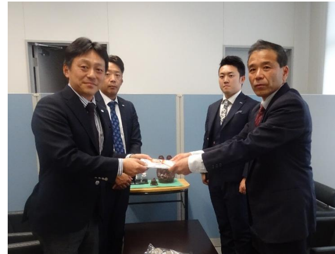
寄贈の様様 (平成29年1月13日／益城町教育委員会)