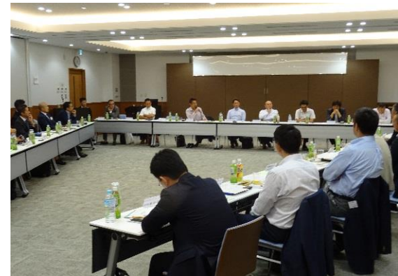
意見交換会の模様