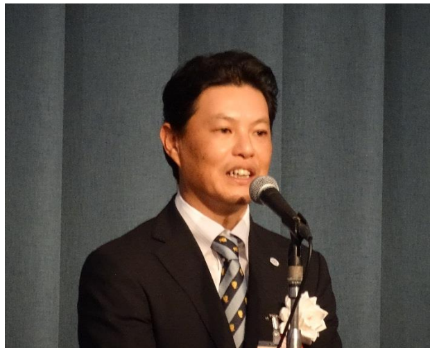
四国ブロック大会 (11月18日／約130名参加)