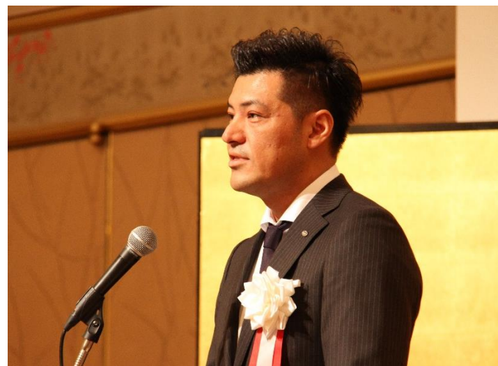
北陸信越ブロック大会 (平成28年10月21日／約140名参加)