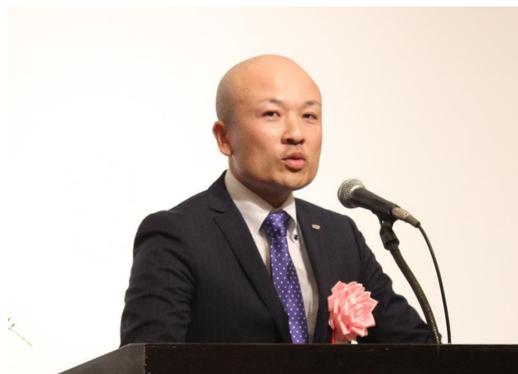
東北ブロック大会 (平成28年10月27日／約150名参加)