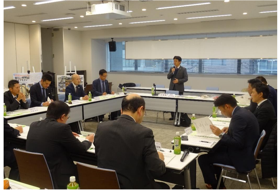
青年部会の運営について検討