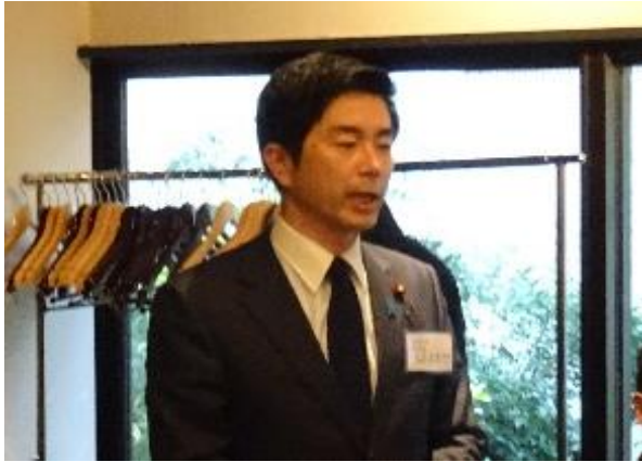
自民党 牧原英樹 青年局長(当時)