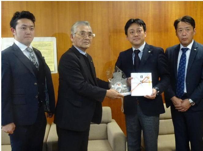
寄贈の様様 (平成29年1月13日／南阿蘇村教育委員会)