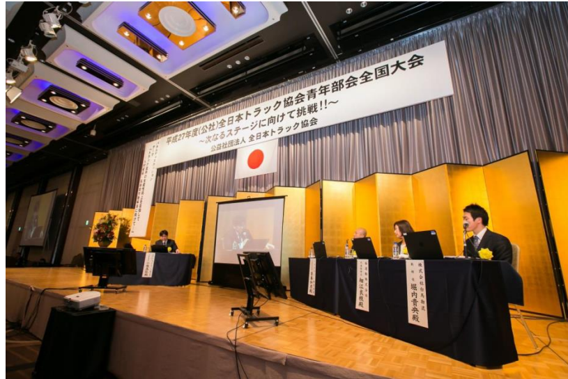
青年経営者によるパネルディスカッション (昨年の模様)