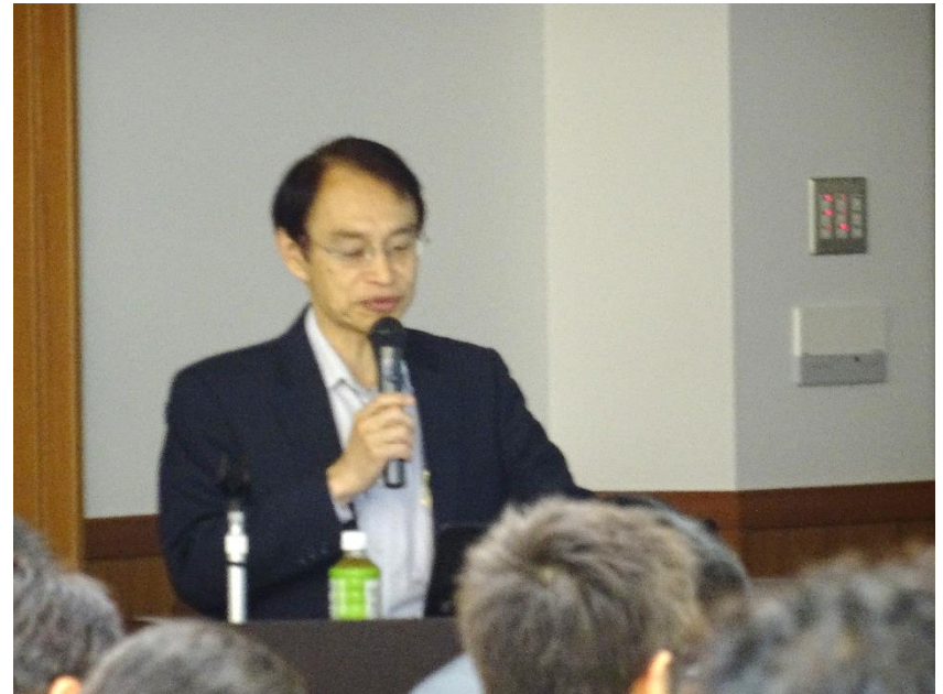
全ト協 細野専務理事を招き、研修を実施