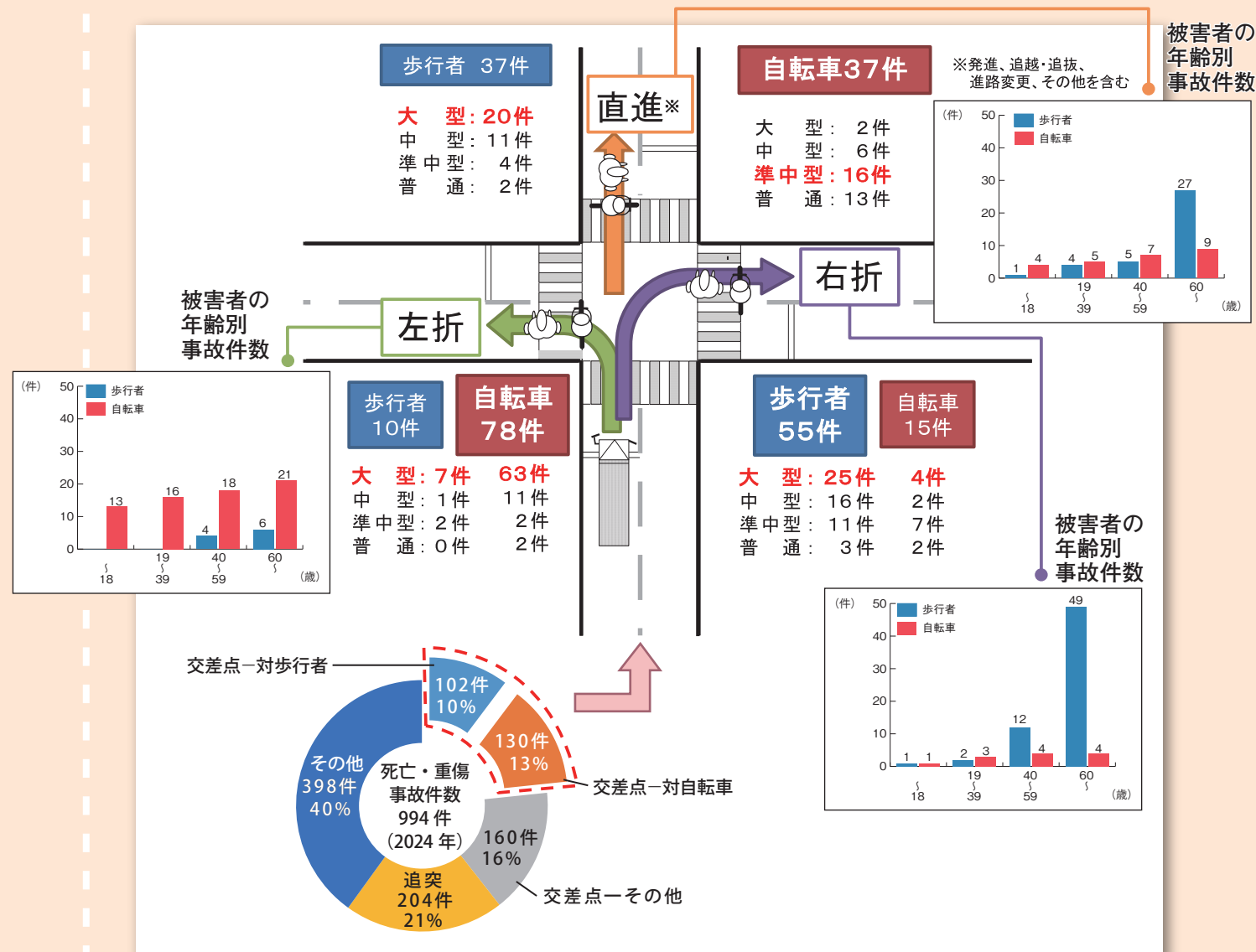
出典：(公財)交通事故総合分析センター ※「死傷事故件数」および「死亡・重傷事故件数」は事業用貨物自動車を第1当事者とするもの(軽自動車を除く)