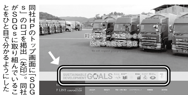
同社HPのトップ画面にSDGsのロゴを掲載(左側)。同社がSDGsに取り組んでいることをひと目で分かるようにした。

「SDGsに資する取り組み」としてHP上で「見える化」し、分かりやすく伝えていくことで、運