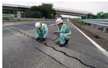
橋梁伸縮装置の点検