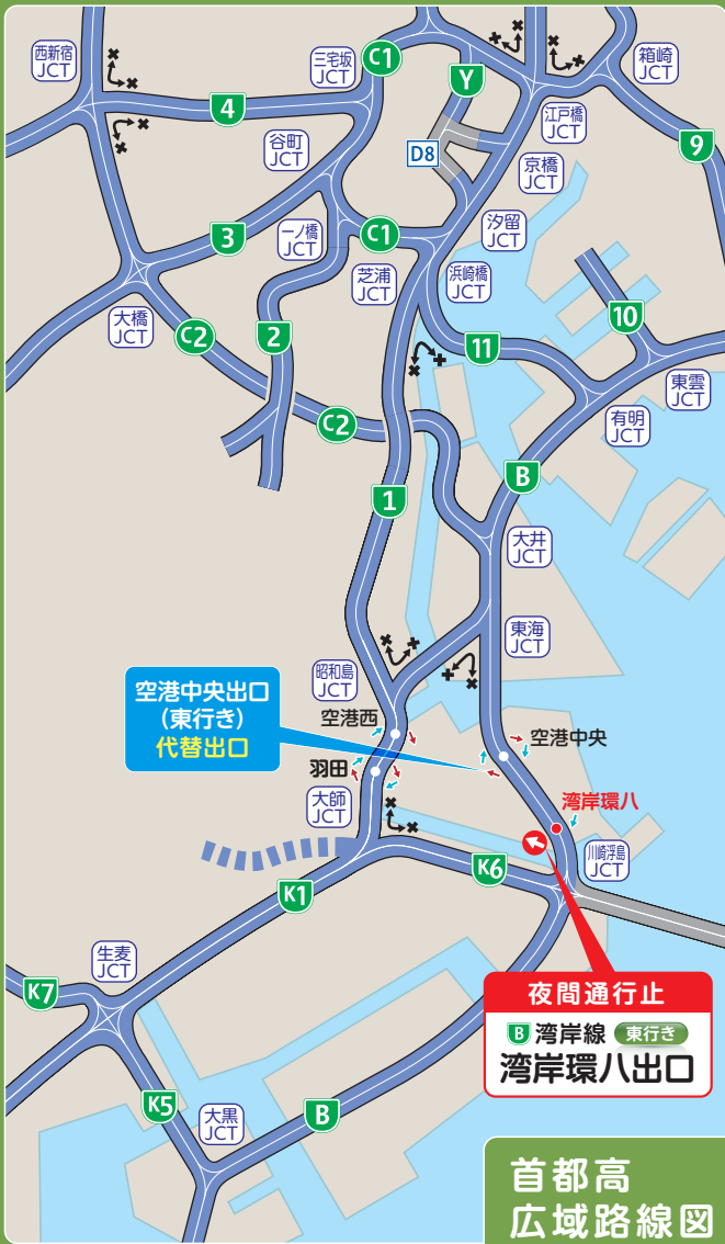
首都高 広域路線図

工事期間中、夜間通行止以外の時間帯は、湾岸環八出口(東行き)において1車線規制を行います。ご通行の際は十分ご注意ください。