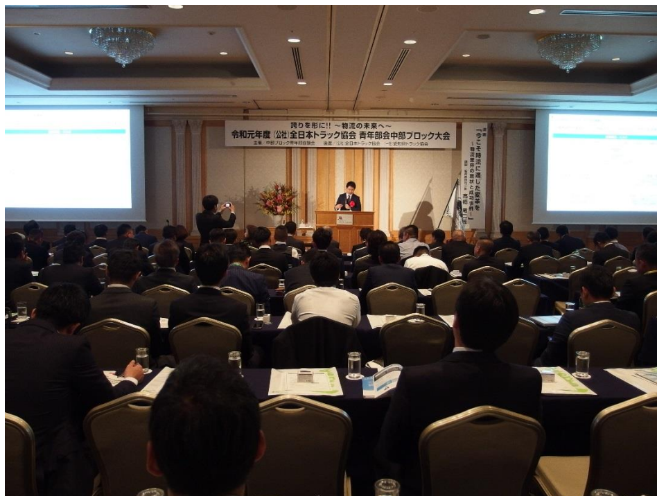
中部ブロック青年部協議会等に所属する青年経営者ら280名が参加