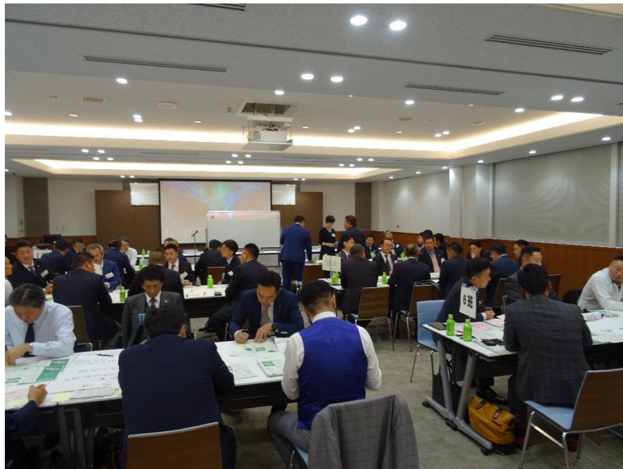
全国の青年組織代表者ら52名が参加