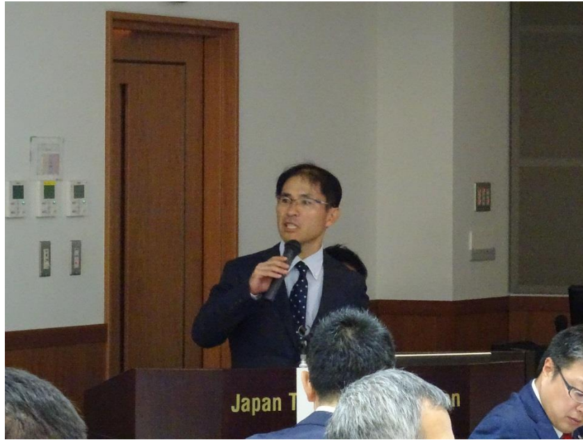
基調講演をいただく国土交通省自動車局総務課企画室長 星明彦様