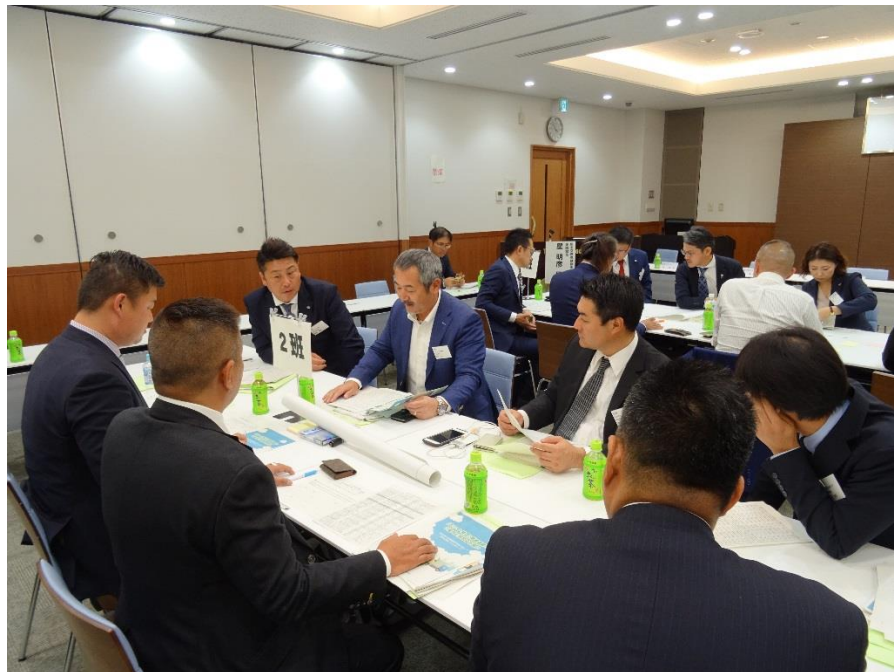
班毎にグループディスカッションを行う参加者