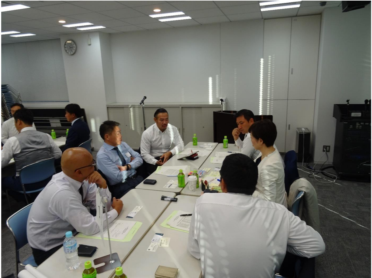
グループディスカッションの様様