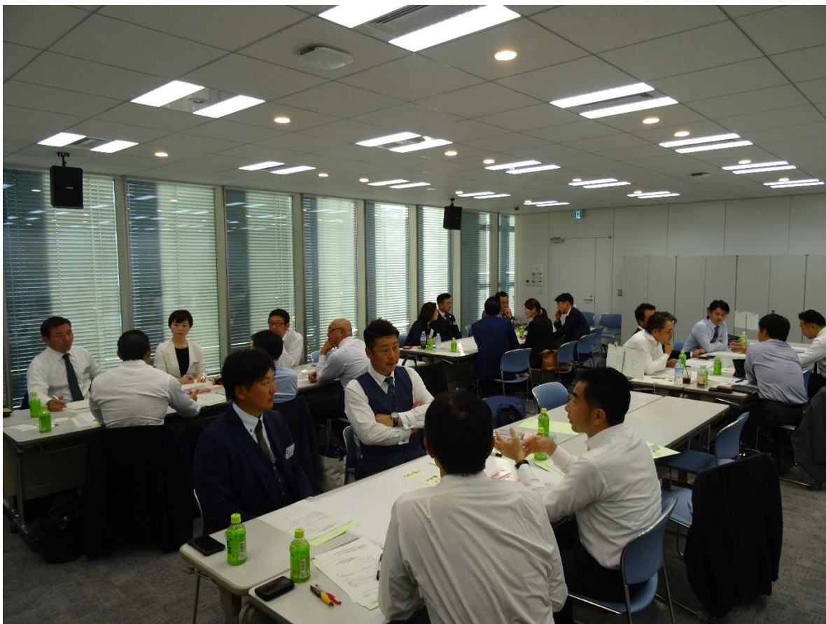
「各業界が抱える課題（生産性向上や人材不足など）の共有と解決策について」 をテーマにグループディスカッションを行う参加者