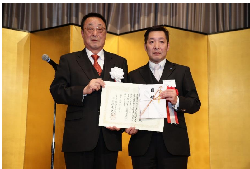
青年経営者顕彰授与式（銀賞：滋賀県トラック青年協議会）