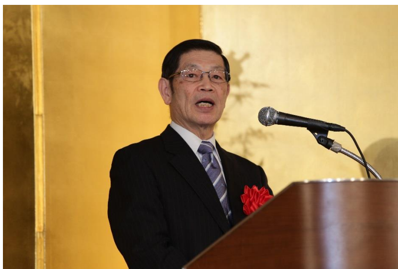
杉山審査委員長による講評