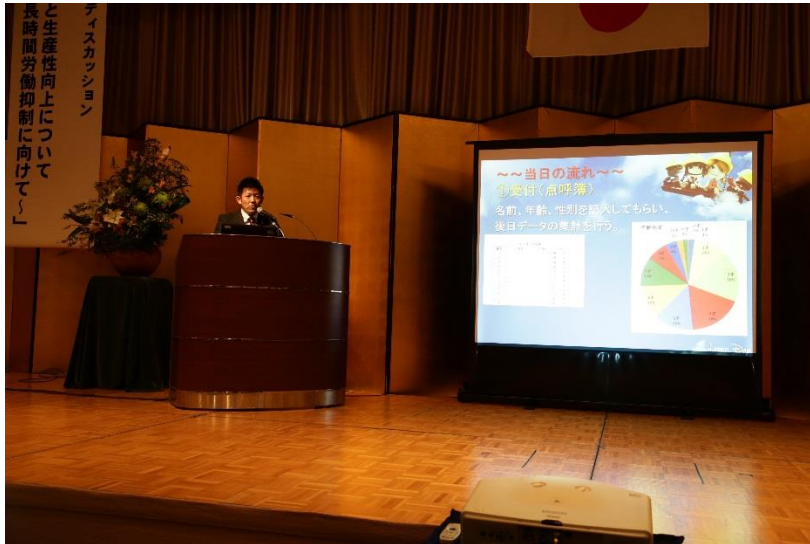
青年経営者顕彰事業発表（金賞：広島県トラック協会青年部協議会）