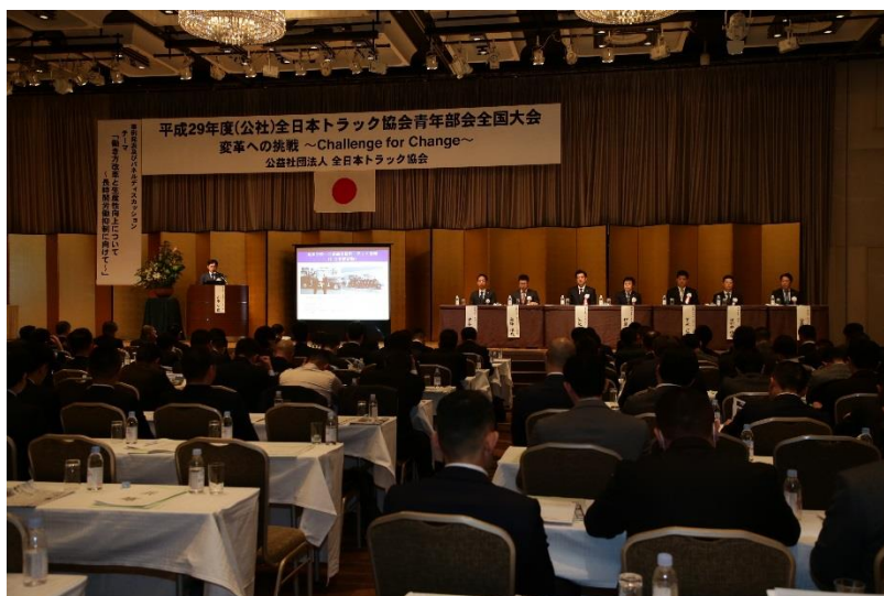
平成29年度青年部会活動報告