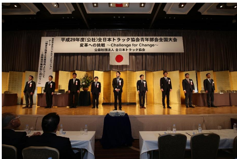
閉会挨拶を行う宮原副会長