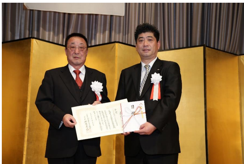
青年経営者顕彰授与式（金賞：広島県トラック協会青年部協議会）