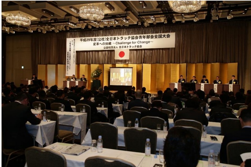
パネルディスカッションの様様