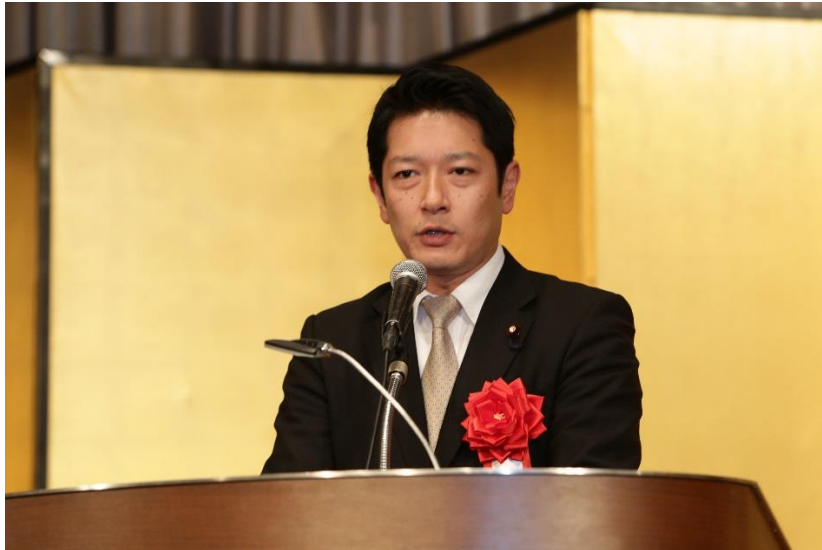
自由民主党青年局団体部長 田野瀬衆議院議員