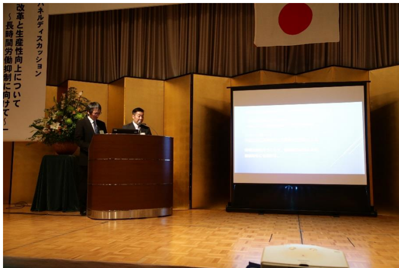
青年経営者顕彰事業発表（銀賞：滋賀県トラック青年協議会）