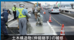
土木構造物(伸縮継手)の補修