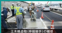
土木構造物(伸縮継手)の補修