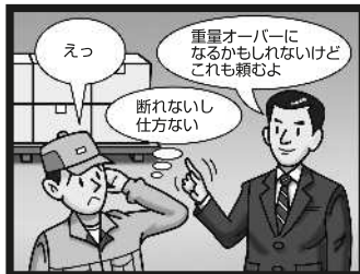
過積載になるような依頼