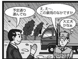
大型台風や豪雨・豪雪日の配送