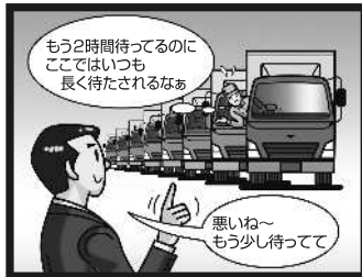
恒常的に長い荷待ち時間