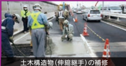
土木構造物(伸縮継手)の補修