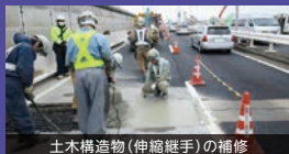
土木構造物(伸縮継手)の補修