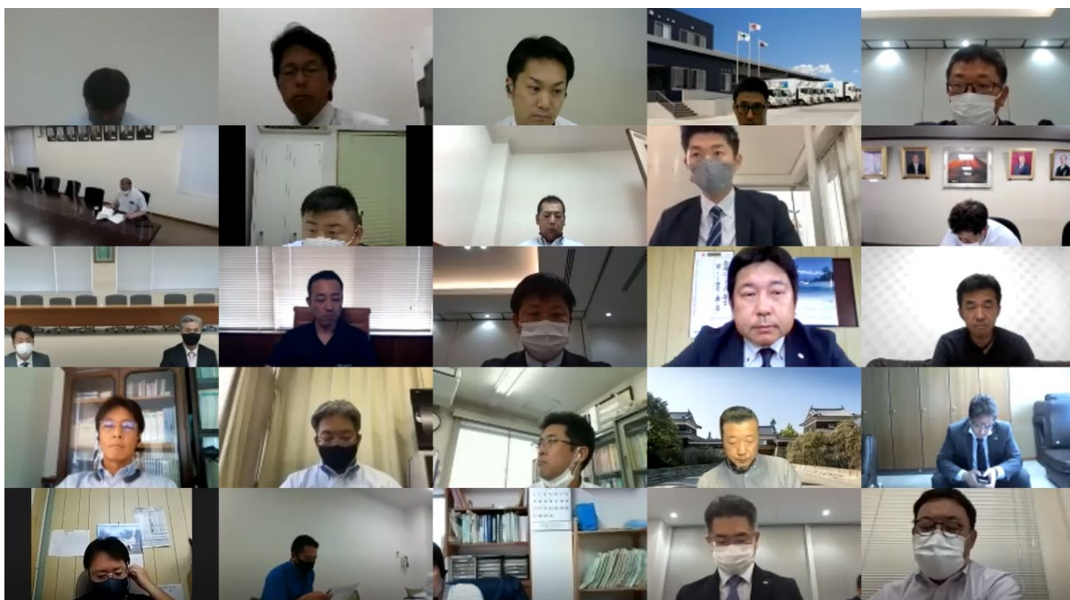
全国の青年組織代表者ら64名が出席した