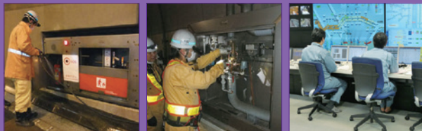
泡消火栓点検 水噴霧装置点検 施設管制室

首都高の山手トンネルには万一の事故や火災が発生した場合に備え、施設防災システムを設置しています。トンネル防災設備点検では、自動火災検知器や水噴霧装置、泡消火栓などの動作点検を定期的に行っています。