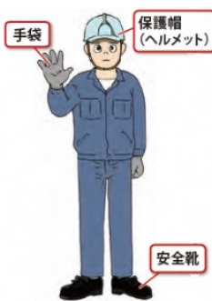
作業者に身につけてほしい望ましい装備例