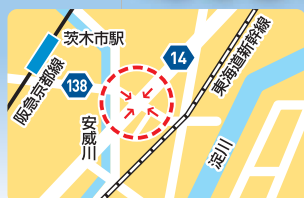
西面大橋西交差点