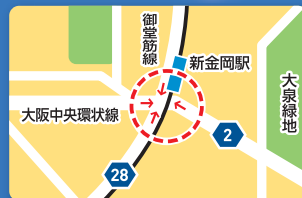
北堺警察署前交差点