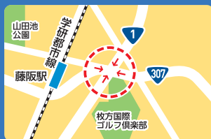
津田北町3丁目交差点