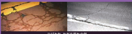
ひびわれ、わだち揺れの例

お客さまに快適に走行いただけるよう、日常的な巡回点検、定期的な詳細点検により舗装路面状況を適切に把握し、劣化箇所を補修しています。