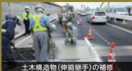
土木構造物(伸縮継手)の補修