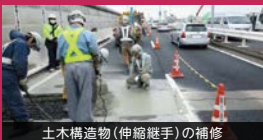
土木構造物(伸縮継手)の補修