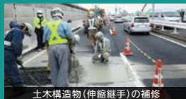
土木構造物(伸縮継手)の補修