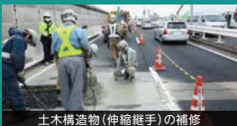
土木構造物(伸縮継手)の補修