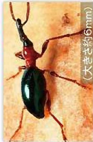
アリモドキゾウムシ (大きさ約6mm)