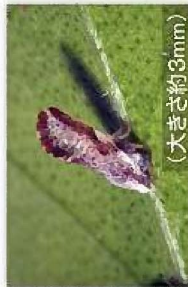
ミカンキジラミ (大きさ約3mm)