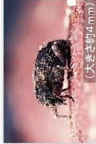
イモゾウムシ (大きさ約4mm)