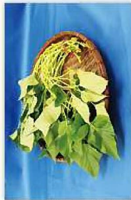
サツマイモ(紅イモなど)の生莖葉