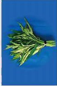
エンサイ(空心菜・ウチンチャーバー)の生莖葉