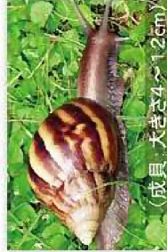
アフリカマイマイ (成貝・大きさ4~12cm)

詳しくは下記へお問い合わせください (蒸熱処理に関するお問い合わせは★印の植物防疫所へ)