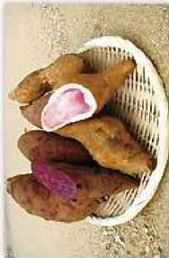
サツマイモ(紅イモなど)の生塊根