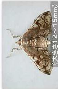
サツマイモノメイガ (大きさ12~15mm)