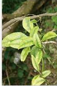
カンキツグリーニング病菌 (病気の症状)