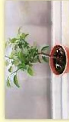
カンキツ類の苗木

詳しくは、事前に裏面★印の植物防疫所にお問い合わせください。なお、現在小笠原諸島には蒸熱処理施設がありません。