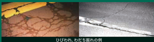
ひびわれ、わだち振れの例

お客さまに快適に走行いただけるよう、日常的な巡回点検、 定期的な詳細点検により舗装路面状況を適切に把握し、劣化 箇所を補修しています。