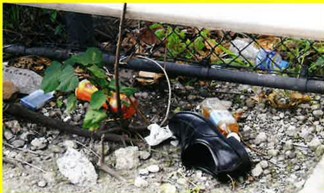
国道122号線沿いのゴミ

ポイ捨てされたゴミのほとんどは車中食された飲食物のゴミ(弁当の空き容器やペットボトル)でした。