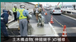
土木構造物(伸縮継手)の補修