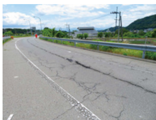
傷んだ路面のようす (イメージ)