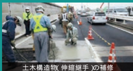
土木構造物(伸縮継手)の補修