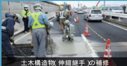
土木構造物(伸縮継手)の補修