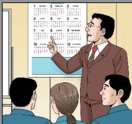
安全教育の定期実施