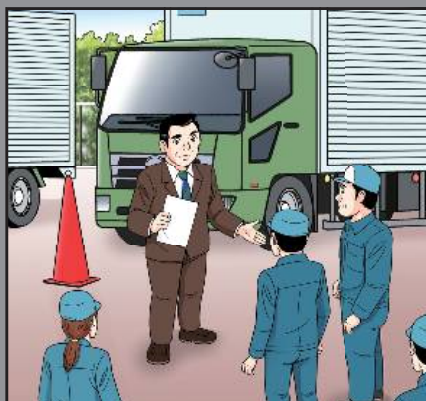
技術・安全指導の徹底