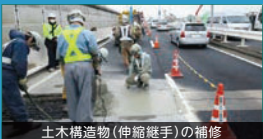
土木構造物(伸縮継手)の補修