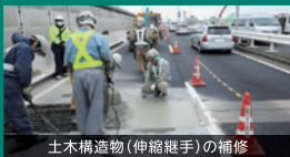
土木構造物(伸縮継手)の補修