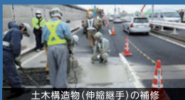
土木構造物(伸縮継手)の補修