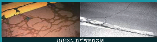
ひびわれ、わだち掘れの例

お客さまに快適に走行いただけるよう、日常的な巡回点検、定期的な詳細点検により舗装路面状況を適切に把握し、劣化箇所を補修しています。