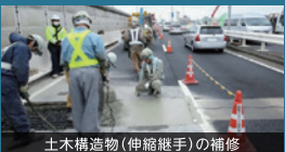
土木構造物(伸縮継手)の補修