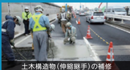
土木構造物(伸縮継手)の補修