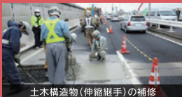
土木構造物(伸縮継手)の補修