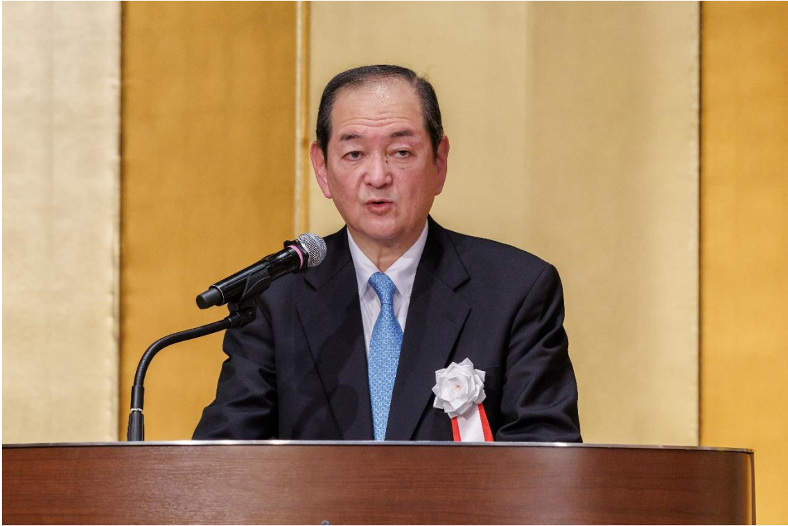
青年経営者顕彰の講評（庄子副会長）