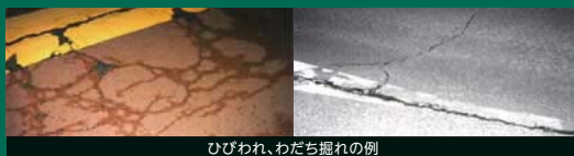
ひびわれ、わだち掘れの例

お客さまに快適に走行いただけるよう、日常的な巡回点検、定期的な詳細点検により舗装路面状況を適切に把握し、劣化箇所を補修しています。