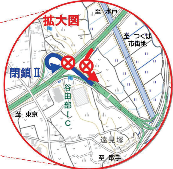
※地理院地図(国土院) ( https://maps.gsi.go.jp/ ) をもとに、東日本高速道路㈱が加工

工事内容や高速道路に関するお問い合わせは 24時間、365日、お客様の声をお聞きしています。 NEXCO 東日本 お客様センター ☎ 0570-024-024 または 03-5308-2424