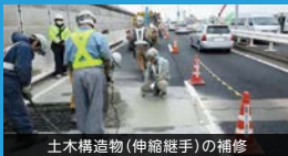
土木構造物(伸縮継手)の補修