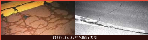
ひびわれ、わだち掘れの例

お客さまに快適に走行いただけるよう、日常的な巡回点検、定期的な詳細点検により舗装路面状況を適切に把握し、劣化箇所を補修しています。