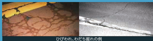
ひびわれ、わだち掘れの例

お客さまに快適に走行いただけるよう、日常的な巡回点検、定期的な詳細点検により舗装路面状況を適切に把握し、劣化箇所を補修しています。