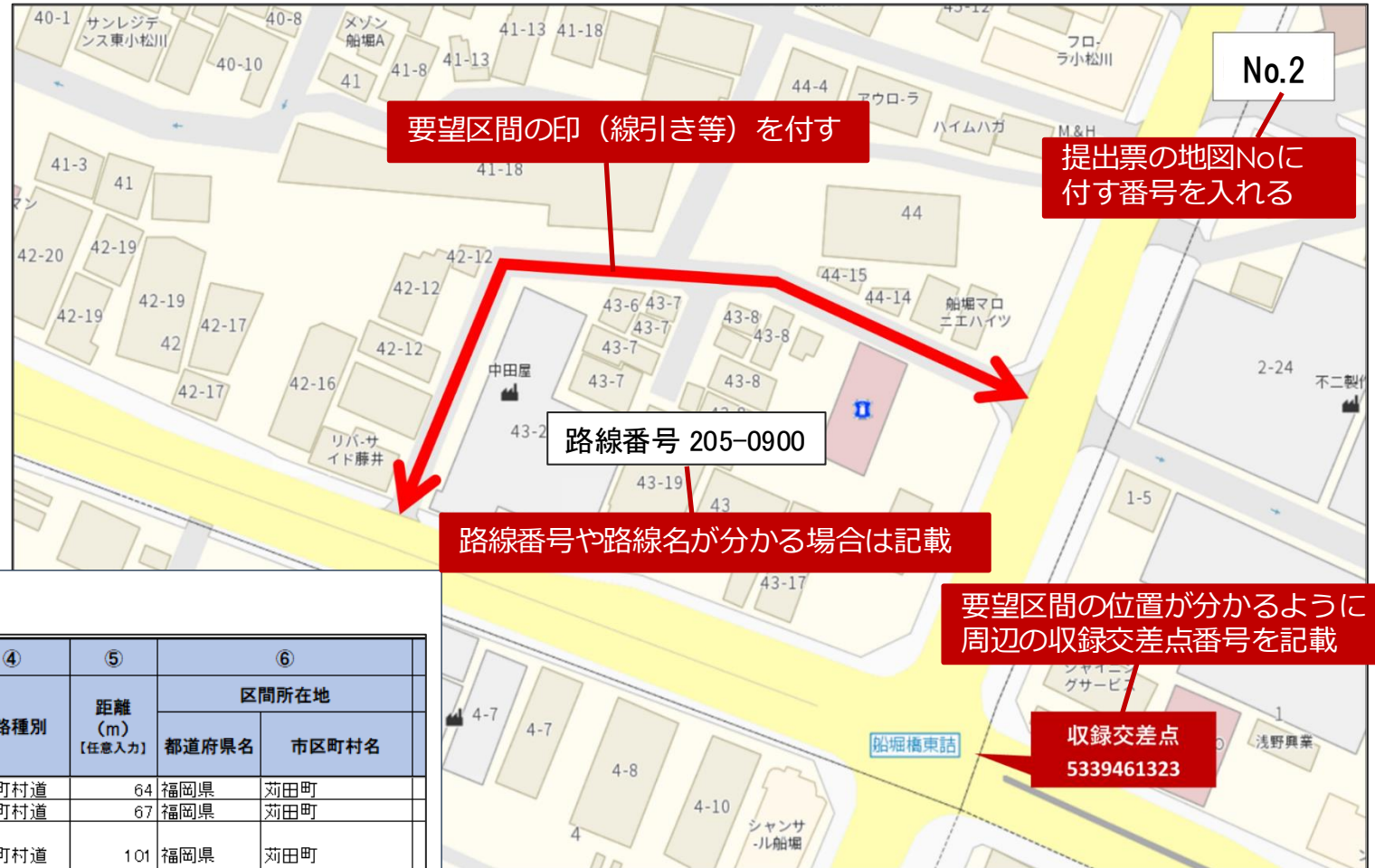
<提出票と見比べた例>

電子地図等により、区間を示した地図を作成し、周辺の収録交差点番号を記載して下さい。 また、要望する道路を特定しやすいように、路線番号や路線名が分かる場合は記載して下さい。